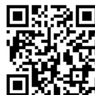
申込みフォーム QR コード

なお、研究集会当日、会場での参加受付も行いますが、可能な限り事前登録にご協力ください。